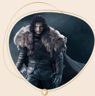
《权力的游戏·凛冬将至》